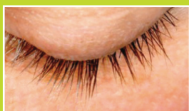
Jour 14 - 46,26 %