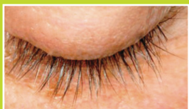
Jour 28 - 66,39 %