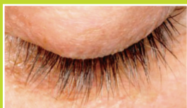
Jour 42 - 72,29 %

Etudes menées par des cliniques indépendantes sur action du SymPeptide® Xlash, composant clé du produit LashesMD®. SymPeptide® est conçu par Symrise Inc. Utilisé avec autorisation.